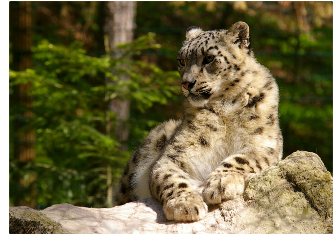
Schneeleopard (Tiergarten Nürnberg © Tiergarten Nürnberg)

Der Tiergarten bietet eine Vielzahl spezieller Führungen an, die interessierten Besuchern einen sprichwörtlichen Perspektivenwechsel ermöglichen. Dabei erfahren Sie unter fachkundiger Leitung neben aktuellen Informationen auch manch nette Episode und auch das, was sich hinter den Kulissen so tut. Entsprechend Ihrer Wünsche wird dabei eine Auswahl von Tieren angesteuert. Die Zoobegleiter/-innen erwarten Sie auch gerne bei der Ankunft der Adlerbahn.