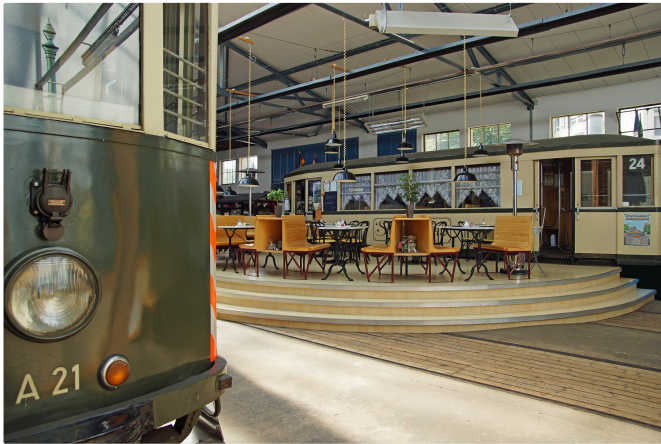
Das Straßaboh-Café