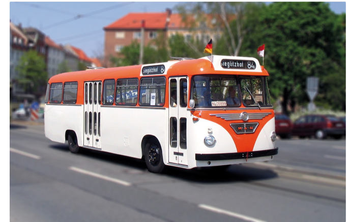
Oldtimer der VAG – Krauss-Maffei. Verkörpert den Omnibusbetrieb Anfang der 1960er Jahre, Baujahr 1959. 31 Sitzplätze

eine Führung kann organisiert werden. Aufenthaltsdauer inkl. Führung: etwa anderthalb Stunden.