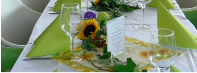
Bistro Lagunenblick

Egal ob Selbstbedienung am reichhaltigen Mittagsbuffett oder vorherige Menüauswahl, Selbstzahlung oder gegen Rechnung – die Tischreservierung ist immer inklusive.