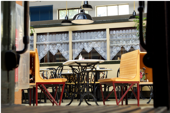
Das Straßaboh-Café