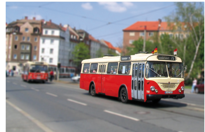
Oldtimer der VAG – Büssing Präfekt. Einer der letzten Busse vor der Standardisierung der Omnibusfahrzeugtypen. Baujahr 1969. 30 Sitzplätze