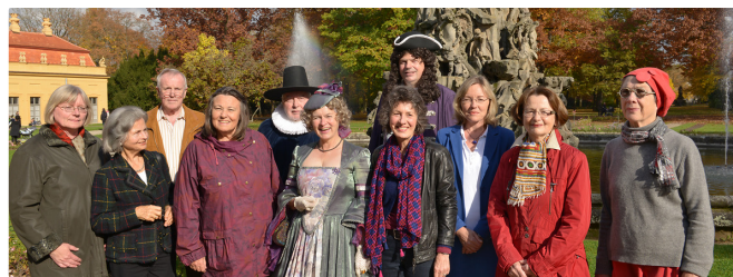
Die Erlanger Stadtführer

Entdecken Sie die Stadt Erlangen in all ihren Facetten Auf unseren geführten Stadtspaziergängen lassen wir vergangene Zeiten wieder lebendig werden und decken die zahlreichen Facetten der Stadt auf: die berühmten, die bekannten und die verborgenen Seiten.