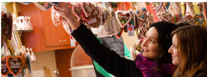
Waldweihnacht (05.12.2013,)

Jedes Jahr verzaubert Erlangen seine Besucher mit zwei verschiedenen Weihnachtsmärkten. Die Waldweihnacht auf dem Schlossplatz zum einen – und zum anderen der Historische Weihnachtsmarkt am Neustädter Kirchenplatz.