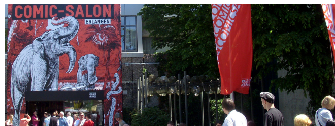
Comic Salon (Viola Raabe © Erlanger Tourismus)

Kultur wird in Erlangen großgeschrieben. Das Stadtmuseum zeigt neben der Geschichte Erlangens interessante Sonderschauen. Im Kunstpalais, das sich im aufwendig sanierten Palais Stutterheim befindet, sind hochkarätige Ausstellungen Programm. Theater gibt es auf den großen und kleinen Bühnen der Stadt. Und dann sind da natürlich noch die Kultur-Festivals, für die Erlangen über die Landes-